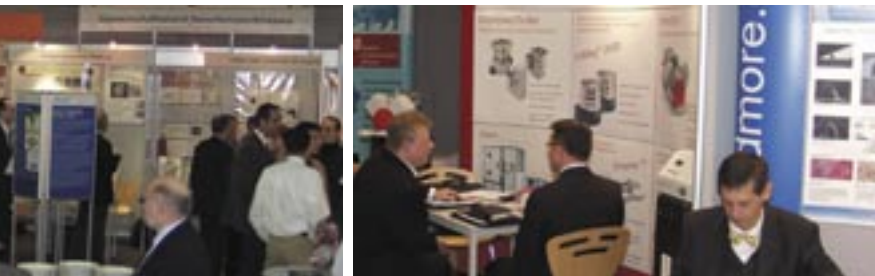
Theorie und Praxis im Dialog: Eindrücke vom 1. Nanotechnologieforum Hessen

HA Hessen Agentur GmbH hessen-nanotech Abraham-Lincoln-Str. 38-42 D-65189 Wiesbaden www.hessen-agentur.de