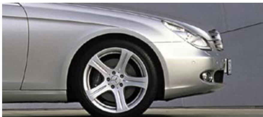
Große Zukunft für kleinste Teilchen: kratzfeste Lacke

Aus Atom- und Molekül-Bausteinen werden komplexe Nanostrukturen „von unten nach oben“ aufgebaut, vergleichbar mit einem Lego-Baukasten. Dieses Konstruktionsprinzip wird häufig in der Biologie und Chemie genutzt.