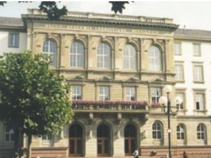
Neue Technologien hinter historischen Gemäuern: Die Justus-Liebig-Universität Gießen

Die Justus-Liebig-Universität (JLU) Gießen mit ihren über 20.000 Studierenden in elf Fachbereichen und sieben wissenschaftlichen Zentren ist die zweitgrößte Hochschule in Hessen.